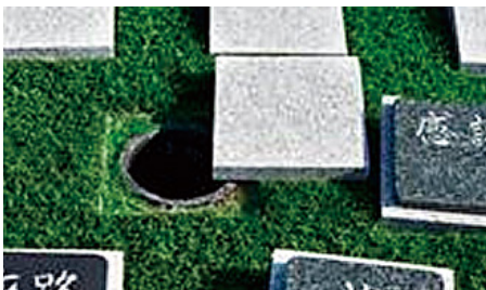
プレートの下の納骨室に、ご家族、3~4名様までお納めできます。