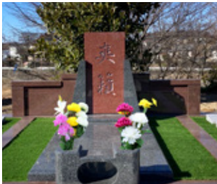
シンボルツリーのもとで静かに埋葬いただけます。