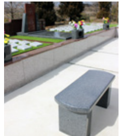
ベンチに腰掛けて、ごゆっくり参拜ください。