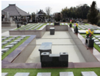
お寺のそばで、安心してお参りいただけます。